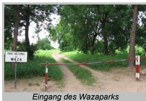
Eingang des Wazaparks

Schliesslich kommen wir am Eingang des Parks an. Wir machen eine kleine Pause, und bezahlen unsere Eintrittsgebühren. Ausserdem müssen wir einen Führer an Bord nehmen, der uns den Weg im Park zeigen und uns natürlich möglichst zu den Tieren führen soll.