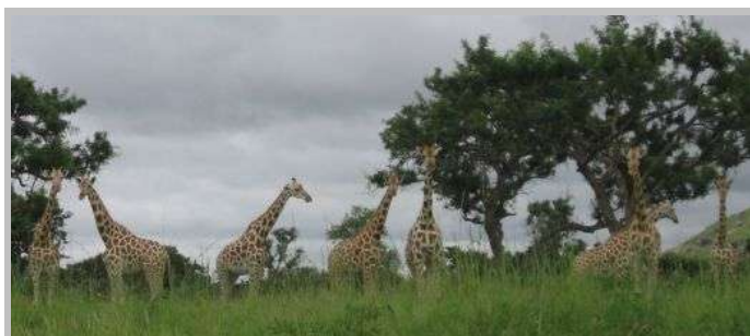
Noch mehr Giraffen

Wir kurven eine ganze Weile durch den Park, der Führer zeigt mal hierhin, und mal dorthin. Die Wege sind kaum zu erkennen, da das Grass recht hoch steht. Ab und zu fahren wir durch Wasser, aber der Untergrund ist stets ausreichend fest.