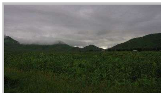
Regen, hier aber ausserhalb des Parks.

Schliesslich fahren die Leute weiter, und von uns schiebt immer einer auf dem Hauptweg Posten, damit die