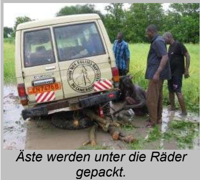
Äste werden unter die Räder gepackt.

Nach langem Warten kommt schliesslich ein Toyota Hilux mit fünf Männern und einer Schaufel. Sie sehen sich die Sache an. Wir beschliessen, unseren Geländewagen nach und nach hochzuheben und starke Äste unter die Räder zu packen. Hinter die Räder soll eine Fahrspur aus Zweigen gelegt werden.