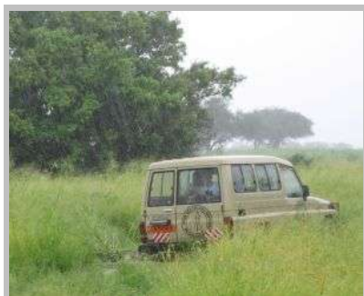
Der festgefahrene LandCruiser im Regen

nicht gesehen hätten. Wir folgen diesem Weg etwa 200 Meter durch das hohe Grass, als das Auto plötzlich im Matsch festsitzt. Vorn und hinten dreht jeweils ein Rad durch, an ein Herauskommen ist so nicht zu denken.