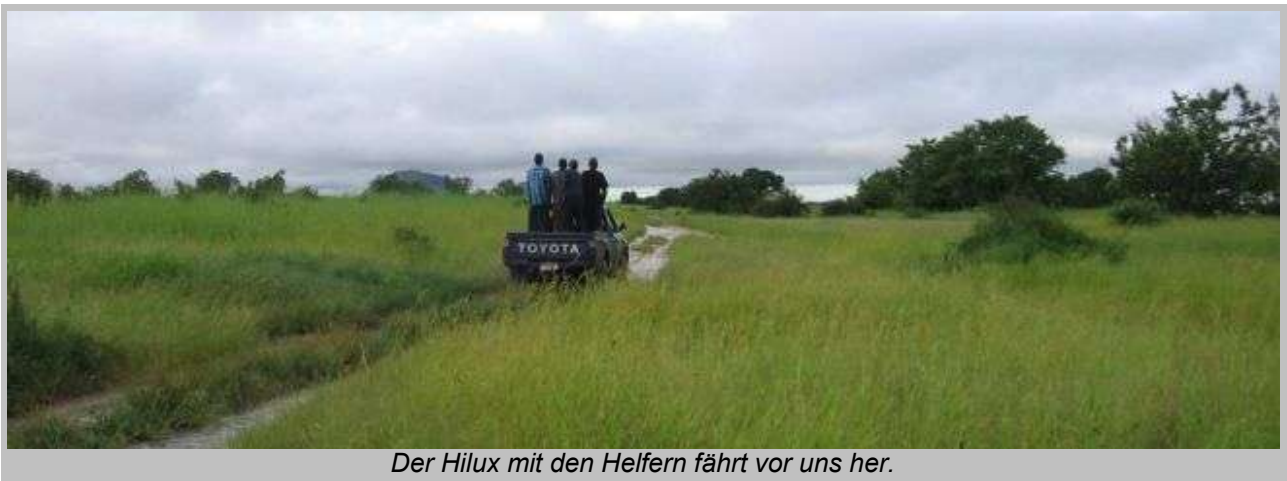
Der Hilux mit den Helfern fährt vor uns her.

Als alles bereit ist, wird unser Bergegurt zwischen unserem LandCruiser und den Hilux gehängt. Die schadhafte Stelle am Bergegurt wird durch einen Knoten unschädlich gemacht.