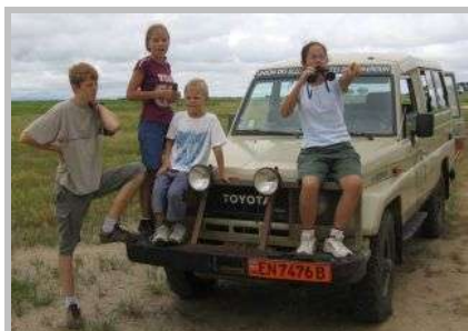
Das Auto wird als Beobachtungsstand genutzt.

Der Schlagbaum wird für uns geöffnet, und wir fahren in den Park. Die Parkgrenzen bestehen übrigens nicht aus Zäunen, sondern die Tiere dürfen ungehindert ein- und ausgehen. Lediglich an den wenigen Zufahrtsstrassen sind Schlagbäume und Parkwächter.