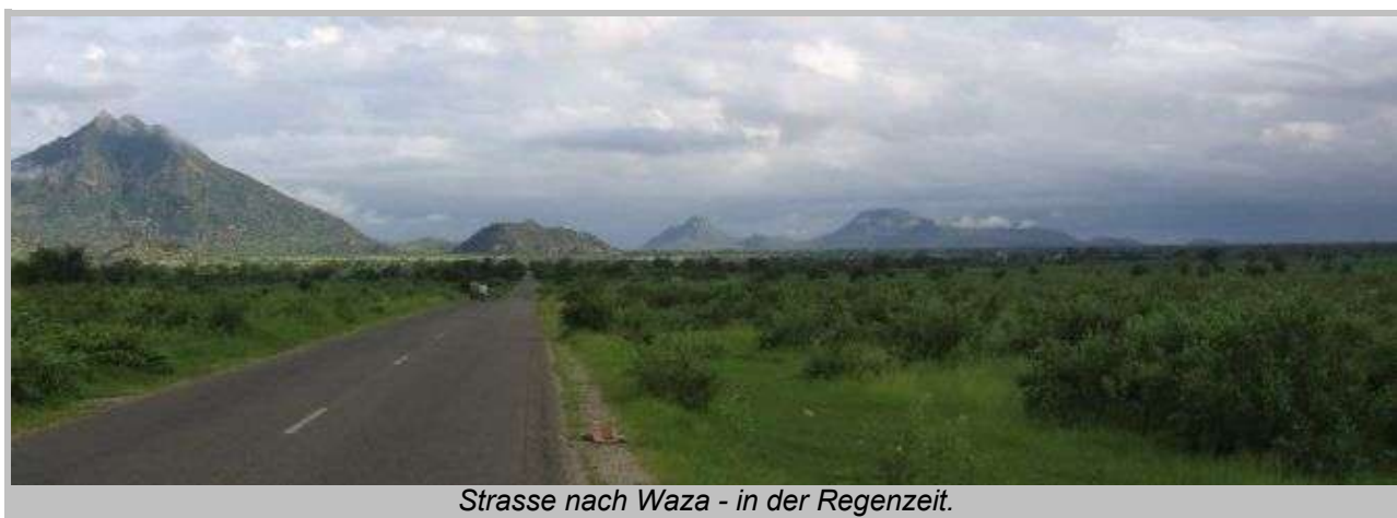
Strasse nach Waza - in der Regenzeit.

Bis zum Wazapark sind wir von Maroua aus etwa zwei Stunden unterwegs. Leider regnet es, was aber in der Regenzeit durchaus normal ist. Überhaupt ist die Regenzeit nicht der ideale Zeitpunkt für einen Besuch im Park, da das Grass hoch steht und die Sicht auf die Tiere erschwert.