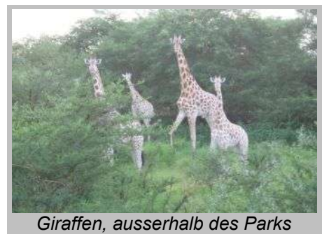
Giraffen, ausserhalb des Parks

Die Lust, noch Elefanten zu sehen, ist vergangen, ausserdem wollen wir Maroua noch bei Tageslicht erreichen, da eine Fahrt im Dunkeln unnötig gefährlich ist. So folgen wir dem Auto der Helfer bis zum Ausgang des Parks.