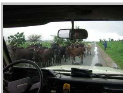
Rinderherde auf der Strasse

Die Landschaft zeigt ein völlig anderes Gesicht als in der Trockenzeit. Alles ist grün und der Himmel bewölkt. Es gibt nicht nur gleissende Sonne und harte Schatten, sondern ein angenehm diffuses Licht.